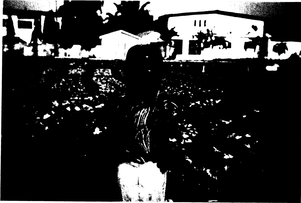
Şekil 1. Gana’da atıksu ile sulama

Ancak nitrat miktarları çok yüksek olan geri kazanım suları bitki gelişimine engel teşkil edebilmektedir. Ayrıca, sürekli geri kazanım sularıyla sulanan topraklarda tuzlanma, çözülmüş katıların ve ağır metallerin birikmesi gibi sorunlar oluşabilmektedir. Bu nedenle bu suların sulamada kullanımında toprak kalitesine ve sulanacak bitki türüne göre sulama yapılması önem taşımaktadır. Geri kazanım suları çoğunlukla yem bitkilerinin, lifli bitkilerin, sınırlı olmakla birlikte orkide bahçelerinin ve üzüm bağlarının sulanmasında kullanılmaktadır.