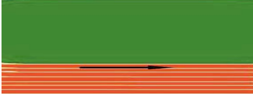
20 m Koşu

Çabukluk ve hız testi yüksek çıkışla başlar. Fotoselle çıkış yapılacağından ayrı bir start uyarısı verilmeyecektir. Sadece o istasyondaki görevli öğretmenin “ Hazır olduğunda çıkabilirsin” komutu ile başlayacaktır. Bu testte 2 hak verilecektir. En iyi derece puanlamaya alınacaktır.